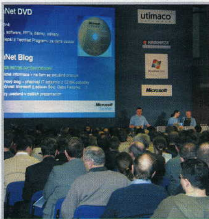
3. Zaplněný sál dychtivě hltal zmínky o tehdy ještě neodloženém systému Windows Vista