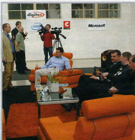
6. Na výstavě se přišli podívat na filmy zástupci firem Intel, Microsoft, BVV a Studio Jasyko