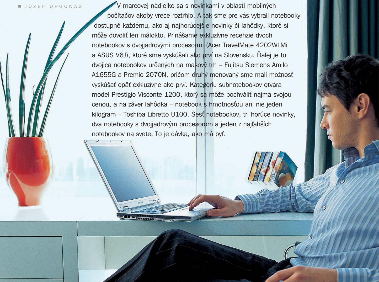
Tabuľka technických parametrov testovaných notebookov

V marcovej nádielke sa s novinkami v oblasti mobilných počítačov akoby vrece roztrhlo. A tak sme pre vás vybrali notebooky dostupné každému, ako aj najhorúcejšie novinky či lahôdky, ktoré si môže dovoliť len málokto. Prinášame exkluzívne recenzie dvoch notebookov s dvojjadrovými procesormi (Acer TravelMate 4202WLMi a ASUS V6J), ktoré sme vyskúšali ako prví na Slovensku. Ďalej je tu dvojica notebookov určených na masový trh – Fujitsu Siemens Amilo A1655G a Premio 2070N, pričom druhý menovaný sme mali možnosť vyskúšať opäť exkluzívne ako prví. Kategóriu subnotebookov otvára model Prestigio Visconte 1200, ktorý sa môže pochváliť najmä svojou cenou, a na záver lahôdka – notebook s hmotnosťou ani nie jeden kilogram – Toshiba Libretto U100. Šesť notebookov, tri horúce novinky, dva notebooky s dvojjadrovým procesorom a jeden z najlahších notebookov na svete. To je dávka, ako má byť.